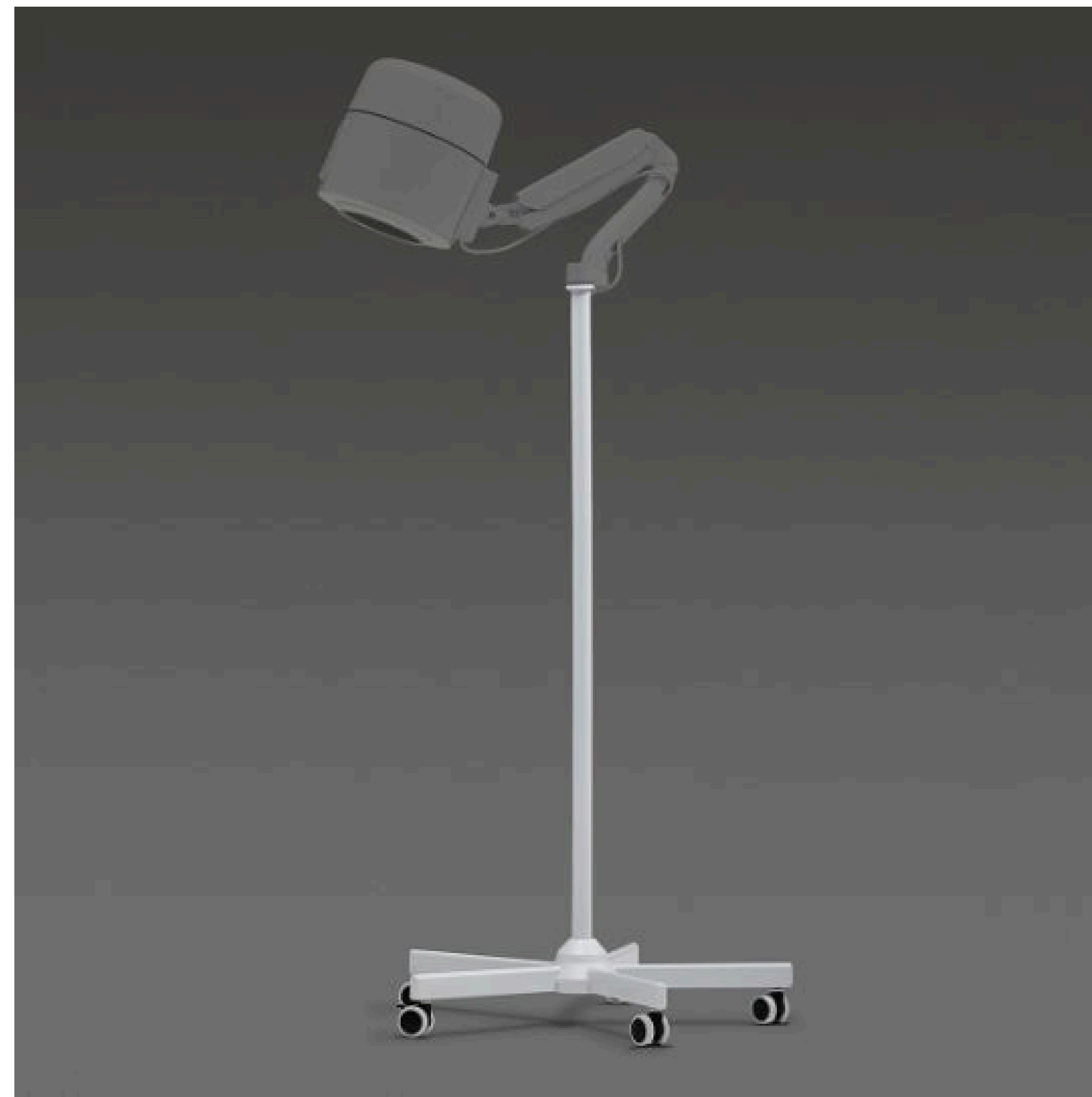
Напольная стойка для вытяжки 4BLANC PRO